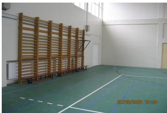
Sala de sport