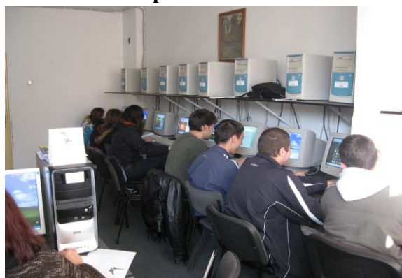
Laborator informatica – conexiune internet