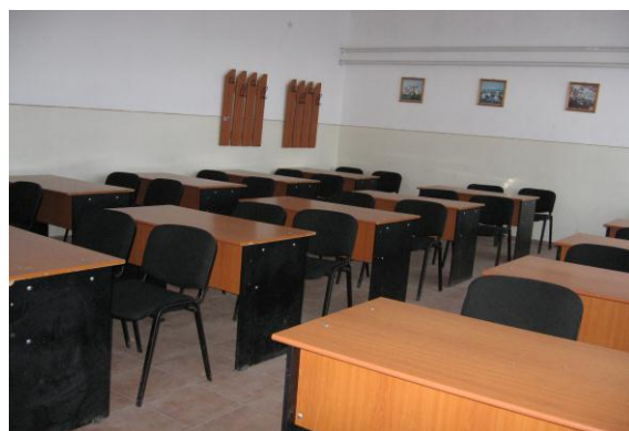
Sala de curs