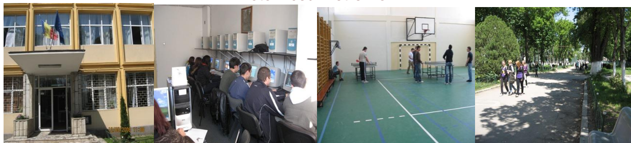
Foto Liceul Petre Poni

Liceul Petre Poni dispune de resurse materiale care asigură un ambient placut și condiții didactico-materiale la standarde europene, Cladirea școlii și sala de sport au fost renovate și reabilitate termic în anul 2007.